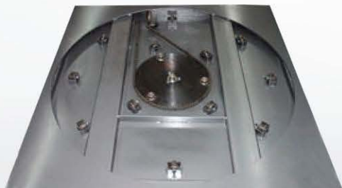
SONIC LPS ▶